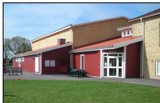
Nya sporthallen och biblioteket byggt som en fortsättning på skolan

Den efterlängtdade sporthallen fanns med i planerna redan på 1950-talet när centralskolan byggdes. Mer än 50 år senare finns den i alla fall på plats med full verksamhet för alla åldrar. För närvarande är det totalt cirka 90 barn i förskola och skola. Lärare och övrig personal ger ett femtontal arbetstillfällen