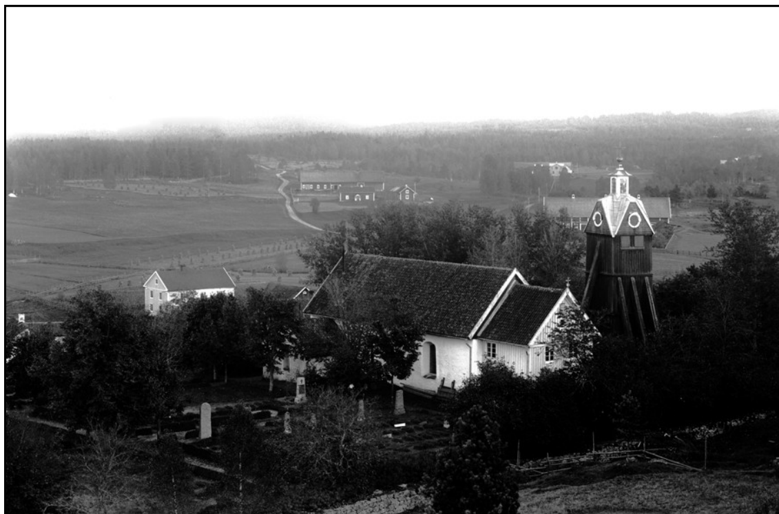
Vy över Ödestugu. Kortet tagit på 1930-talet av lanthandlare K A Svensson. i förgrunden kyrkan och klockstapel, längre ner lanthandeln och grusvägen mot Malmbäck.