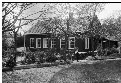
Folkskolan, numera Ödestugu församlingshem

I början var tydligen både folkskola och småskola ambulera skolor. När sockenstugan byggdes år 1851 fick folkskolan sin fasta lokal i norra delen av bottenvåningen. Folkskolan var kvar här tills en ny skola byggdes 1886, den byggnad som numera är församlingshem.