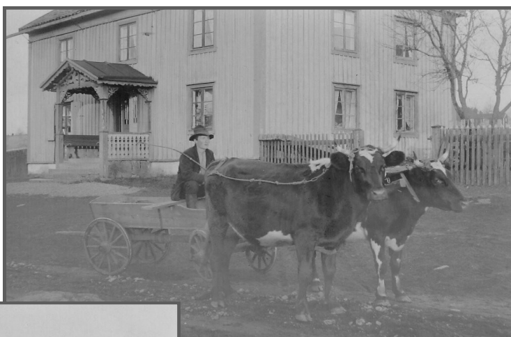
med oxar framför vagnen...