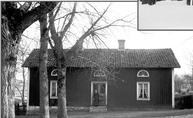
← ”Fattigstova” huset till vänster om gången upp till kyrkan