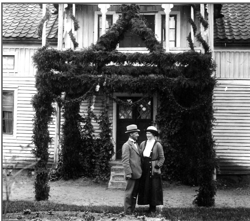
Bild från Karls och Ebbas bröllop oktober 1921 paret under den stiliga äreporten utanför Klockargården