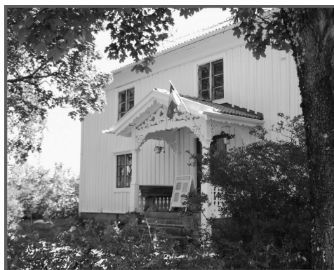
Nya tak, nymålat och renoverat Lanthandelshuset liksom bodar och magasin är ett vackert blickfång i den genuina bymiljön, som är klassad som riksintresse.

Tack vare sökta och erhållna medel från Länsstyrelse, Jönköpings kommun, bidrag från EU, sparbanksstiftelsen Alfa, fonder mm, har mycket kunnat göras. Dessutom gåvor från sockenbor, modevisning och, inte minst, 900 timmars ideellt arbete har bidragit till att den gamla lanthandeln nu pryder sin plats i byn.