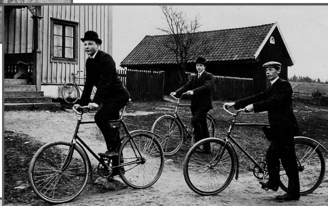
stiliga herrar på cykel