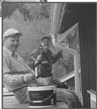
Full fart på renoveringsarbetet