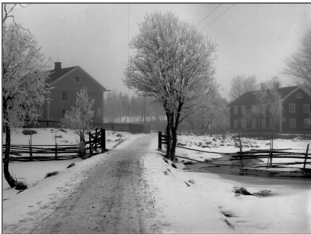
Lanthandeln till vänster och kommunalhuset till höger början av 1900-talet infarten från Tönhultshållet