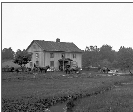
Bilden: En tidig bild av lanthandeln, inget magasin byggt och ingen kanal grävd.

För att lanthandeln skulle finnas kvar i Ödestugu tog häradsdomare August Lidström över tills vidare.