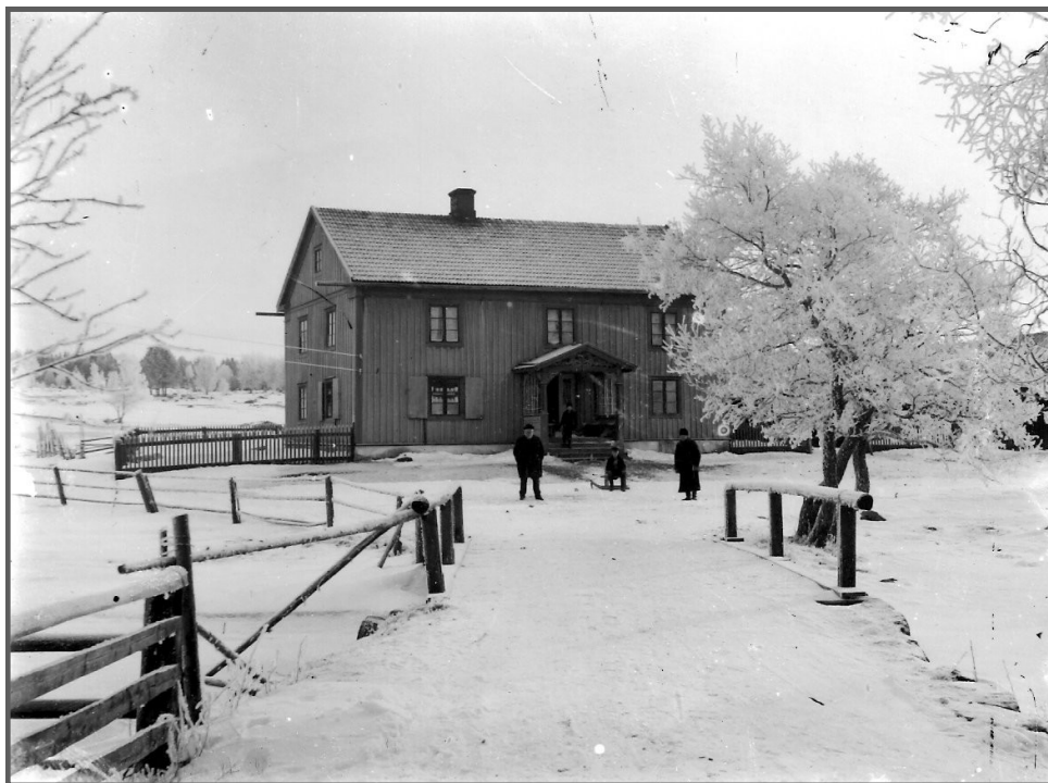
Fina bilder tagna för kanske mer än hundra år sedan, ett arv från lanthandlarfamiljen Svensson. Här på bilden lanthandeln, i förgrunden bron över ån.

Under sommarens våffelkvällar i Sockenhuset är även affären öppen 18.00 - 21.00 onsdagar i juni, juli och halva augusti. Man kan handla godis och hembakt bröd, även kaffeservering finns. Välkomna !