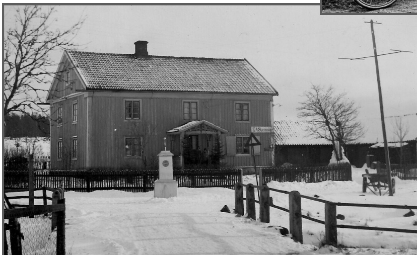
här har en bensinpump kommit upp för att kunna serva alla nya bilägare